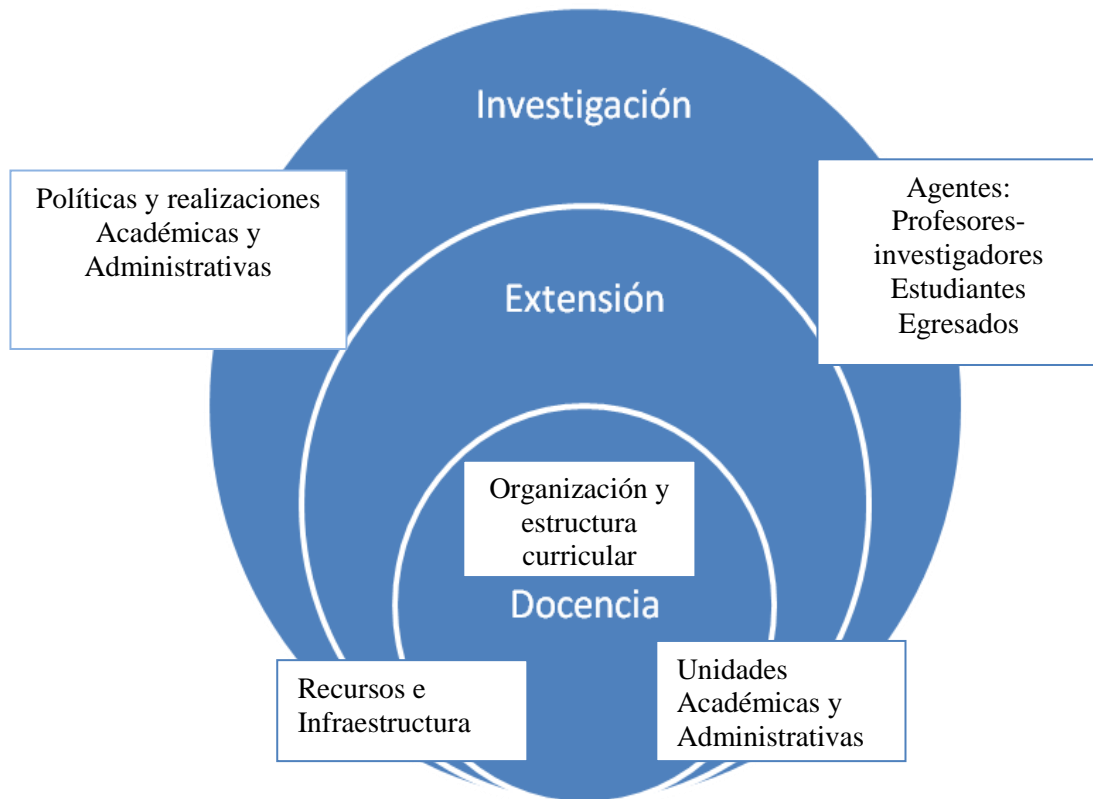
Diagrama 2. Componentes estructurales de los programas de posgrado a ser autoevaluados.

Teniendo en cuenta estos planteamientos y en un primer esbozo de propuesta, el siguiente esquema intenta ubicar estructuralmente cuáles serían los componentes centrales de un programa de posgrado, los cuales se podrían constituir en los aspectos a valorar y redimensionar.